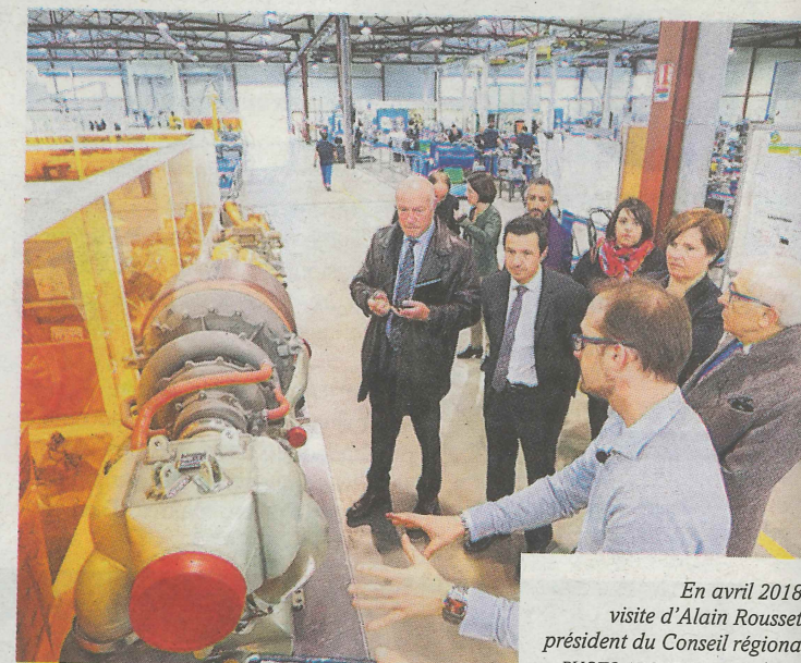
En avril 2018, visite d'Alain Rousset, président du Conseil régional